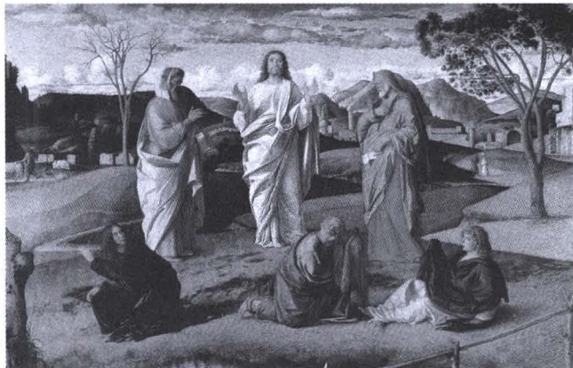
조반니 벨리니의 ‘그리스도의 변모’ 부분

예수님의 수난에 대해서 알아듣지 못하고 피하려고 했던 제자들에게 예수님의 변모 사건은 예수님의 수난 신비를 깊이 깨닫게 하고, 마음의 변화를 가져오게 하는 큰 사건이었다. 우리도 사순절 동안 예수님의 변모 사건을 묵상하면서 예수님의 수난과 파스카의 신비를 깊이 깨닫고 굳은 믿음을 간직해야 하겠다.