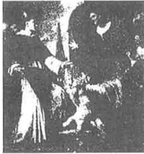
성 빈센트 페레르

도미니코회의 수도사제였고 유명한 설교가였던 그는 스페인의 발렌시아에서 태어났다. 그의 가족 이름이 영국인 성씨인 것은 그의 아버지가 영국인 윌리엄 페레르인데, 스페인에서 정착하고 스페인인 어머니 코스탄자 미구엘과 결혼했기 때문이다.