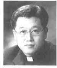
주목성 신부 (서학동 성당 주임)