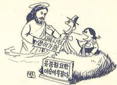
"곧"자가 빠지도록 기도하자.