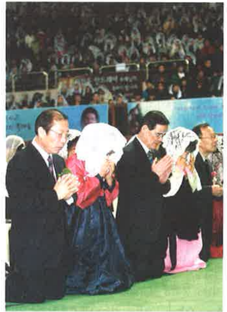
▲새사제 부모들이 성인호칭 기도때 간절한 모습으로 기도를 드리고 있다.