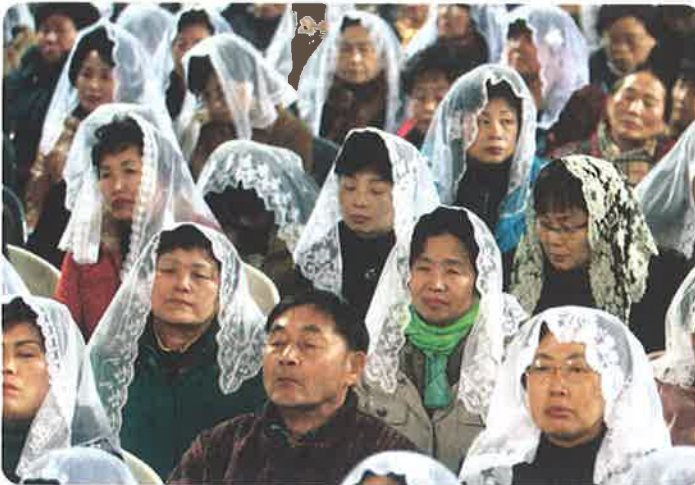
▲새사제들이 바닥에 엎드린채 바치는 성인호칭기도 중에 숙연한 신자들의 모습