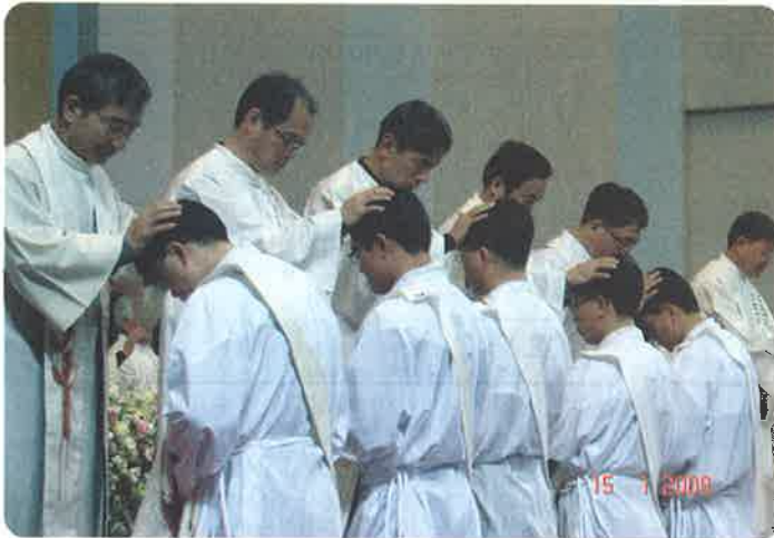
▲선배신부들이 새사제에게 정성을 다해 안수하며 축복하고 있다.