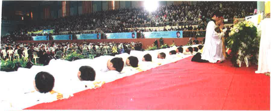
▲새사제들이 가장 비천한 자로 세상에 대해 죽고 오직 주님께 봉사를 다짐하는 부복의식.