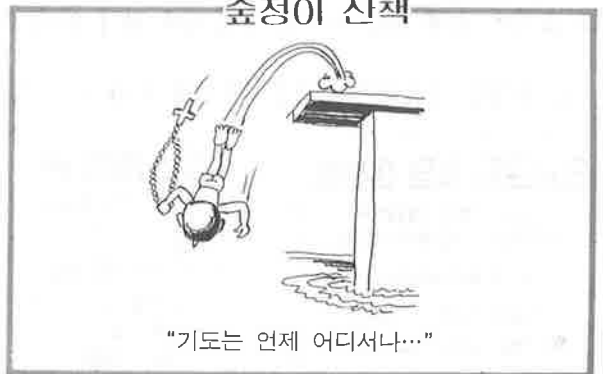
“기도는 언제 어디서나...”