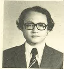
이 원구 (아브라함)

“너희는 흙에서 나왔으니 흙으로 돌아가리라.” 지금 이 자리에서 만나고 있는 우리는 백년 후에는 모두 흙으로 돌아가 있을 것이다. 그때 우리의 모습은 사라지고 들녘의 흙 위에는 말 없는 달빛이 비치고 쓸쓸한 바람만이 스쳐가고 있을 것이다. 우리가 지금 말하고 웃고 즐거워하는 이 생생한 모습은 다 사라져 버릴 것이다. 학교에서 공부하느라고 애를 쓰는 일도, 아이들을 어떻게 하면 잘 기를 수 있을까 하고 고심하는 일도, 가족들의 생계와 안위를 걱정하며 부지런히 뛰어다니는 일도 한 자락의 꿈처럼 어디론가 소멸되어 버릴 것이다.