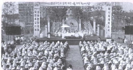
성체 현양 장엄미사

이틀 날인 30일은 청소년 교육국이 주관하는 어린이양 잔치 행사로 이어져 교구 내 각 본당 주일학교 초등부 학생 2,300여 명이 참여해 사생대회, 백일장, 성경암송 대회가 오후 4시까지 개최됐으며, 이후에는 가톨릭 예술인의 밤 행사가 계속되어 특별 출연한 전주 크로마 하