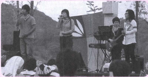
젊은이 희망 콘서트