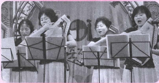
가톨릭 예술인의 밤