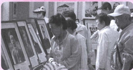
'쌍백합' 주최 역사사진전

프 연주단의 하프연주, 가톨릭 문우회의 시낭송, 전주여성 작은 국악모임의 민요와 장고, 해금연주, 스포츠 댄스, 판토마임, 전주시립무용단 공연, 판소리 등으로 한밤의 향연을 펼쳤다.