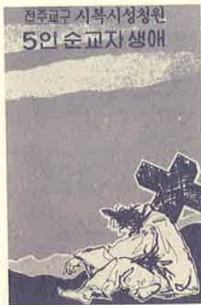
「시복시성 5인 생애 순교 약전」

치명자산 성역화 공사가 활발히 진행됨에 따라 각계 각층의 헌금들이 속속 접수되고 있다. 사제 일곱 분이 690만원을 봉헌하셨고 이 루갈다 후손들이 214만원, 수녀 연합회에서 50만원, 5월의 마돈나 꼬미시움(중앙) 34만원, 익명 100만원 등... 루갈다 부부에 대한 존경과 사랑을, 각자 처한 사정에 맞게 표현하고 있다. 특히 우리 교구 53개 본당중 가장 가난한 본당이라 할 수 있는 나바위 본당은 배부된 가정 봉헌서 100%를 작성하여 보내 왔고, 용안 석동 공소 신자들은 공소 대표를 직접 교구로 보내 일금 백만 원을 봉헌하여 주셨다. 그리고 교구청에 거주하는 신부님들도 부식비를 아껴 우선 64만원을 치명자산 개발 헌금으로 내어 놓았다. 이런 정성에 보답하기 위해 교구에서는 5인 순교자의 생애를 위한 소책자를 발행, 성지개발을 위해 봉헌해 주신 분들께 우송하고 있다. 교구내 모든 신자 가정에 이 소책자가 빠짐없이 우송될 날이 오길 기대한다.