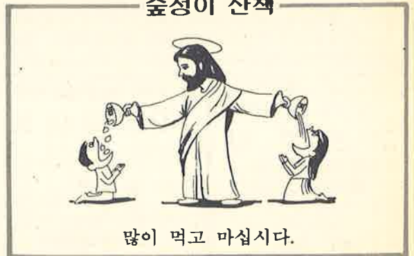
많이 먹고 마십시오.