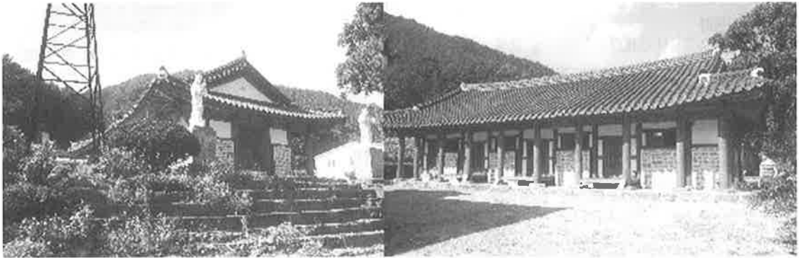
복원된 되재 한옥성당의 정면(오른쪽)과 측면