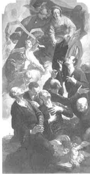
‘성모의 종’ 수도회의 일곱 성인들

이 일곱 사람은 동정녀 마리아에 대한 깊은 신심과 사랑을 가지고 있었는데, 그들은 기도와 덕행의 삶을 통