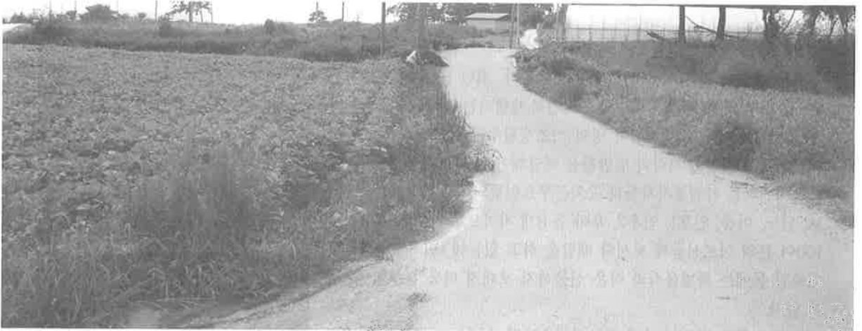
농작물과 잡초가 우거져 옛 모습을 찾을 수 없는 개갑 장터 자리.