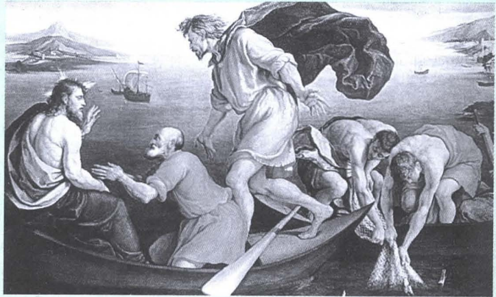
▲ 야코포 바사노, <고기잡이 기적>, 1545. 런던, 개인소장

교구장 주교의 부름으로 세워지는 사도직 협조자는 각자의 다양한 삶의 형태 안에서 하느님의 현존을 드러내며 끊임없는 기도생활로 복음적인 삶을 산다. 사도직 협조자는 하느님의 사랑을 갈망하는 모든 이에게 그분의 사랑을 알게 하고 생활한 접촉을 통해 하느님의 영광과 그분의 나라를 위해 교회의 사도직에 봉사하도록 부름을 받는다. 사도직 협조자는 공동생활을 하지 않으며 다른 평신도들과 똑같은 환경 안에서 이 삶을 살고 있다. 간호사, 사회복지사, 교사, 미용사, 의상디자이너, 요리사, 회사원, 공무원 등등 ... 다양한 직업을 가지고 삶의 현장에서 하느님의 도구로 쓰여지고 있으며 필요성에 따라 교회 안에서 일하