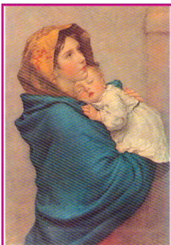
Ferruzzi 은총을 가득히 받으신 이여, 기뻐하여라. 주께서 너와 함께 계신다(루카 1, 28). ☎ 3.6