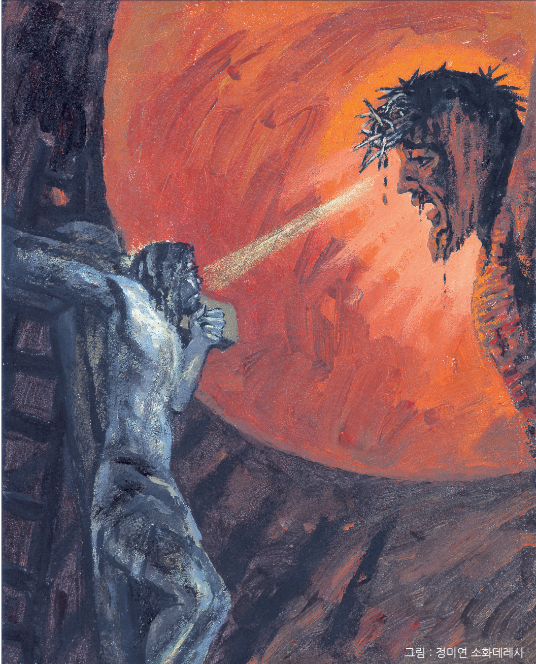
그림 : 정미연 소화데레사

2019년 교구장 사목교서 - “믿음은 들음에서 옵니다.”(로마 10,17)