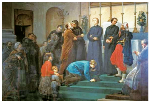
▲ 〈출발〉 샤를르 쿠베르탱(1868)

전주교구청 입구 한쪽 벽면을 가득 채운 이 그림은 선교지를 향해 출발하는 선교사들의 모습이 담겨 있습니다. 1984년 103위 성인품에 오르신 성 브르트니에르와 성 볼리외, 성 위앵과 성 도리신부입니다. 송별하는 이들 사이에서 뒤돌아보는 아이는 화가의 아들인 근대올림픽 창시자 쿠베르탱입니다. 선교사에게 입맞춤하는 이는 작곡가 구노입니다. 당시 조선으로 선교를 떠난다는 것은 박해와 죽음을 각오해야 했습니다. 20대 젊은 나이에 세상의 부와 명예와 안전을 뒤로하고, 복음을 전하기 위한 비장한 발걸음은 얼마나 아름다우지요. /강은원 아내님 수녀(홍보국·성바로떨수도회)