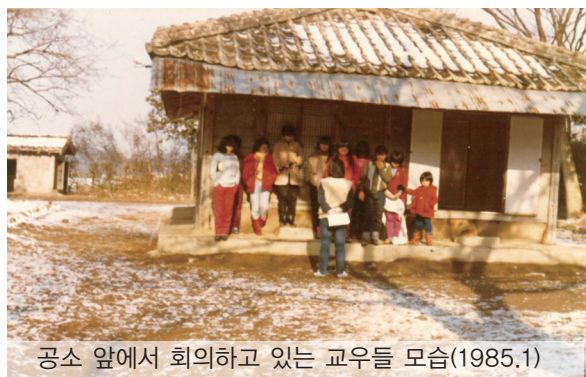
공소 앞에서 회의하고 있는 교우들 모습(1985.1)