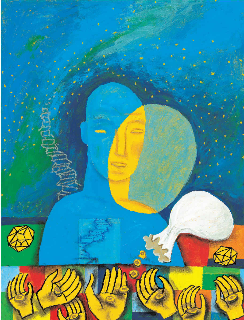
그림 : 정미연 소화테레사

2018년 교구장 사목교서 - “여러분 자신이 변화되게 하십시오.”(로마2,2)