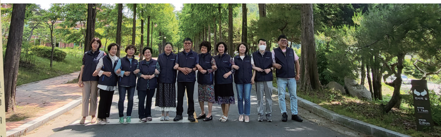
▲ 발로 뛰고 신앙으로 엮어내는 교구 기자단(2002~현재)