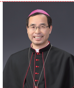
김선태 사도 요한 주교 (전주교구장)