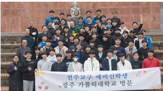
▲ 예비신학생 광주가톨릭대학교 방문 11월 20일(주일) 광주가대