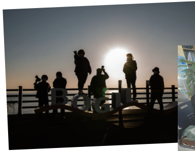
◀ 아름다운 교구의 모습을 담아내는 교구 가톨릭사진가회원(2004~현재)