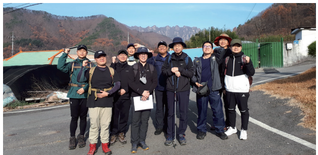
▲ 주교님과 함께하는 새 사제 도보순례 11월 21일(월) 첫 순교자 압송로 제2순례길

라파엘 여행사 성지순례 2.6 이스라엘 보름살아보기 17일간 2.12/3.20 이스라엘 요르단 11일간 2.13/3.20 성모님 발현지 13일간 4.24 산티아고순례길과 포르투갈 14일간 유재구 요한 02)778-8565