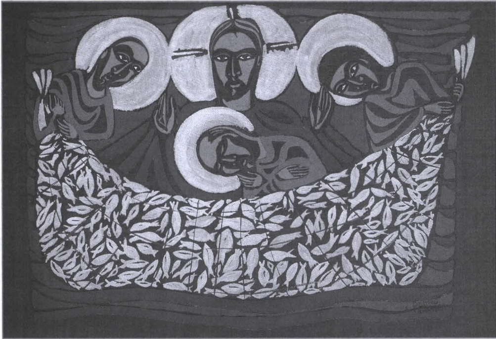
클라우디우 파스트루(1948~), 브라질, '고기잡이 기적'