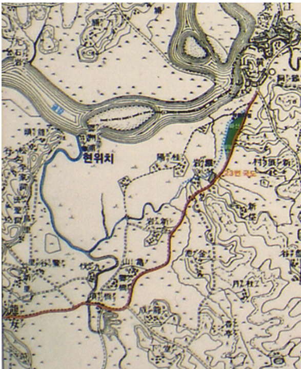
김대건 신부가 냇강을 이용해 나바위로 들어온 뱃길(붉은선)

나바위 성당은 보수가 진행 중이다. 비가 오면 종탑 옆 날개가 새서 서까래가 썩어 보수작업에 들어갔으나, 문화재 전문가들이 원형을 잃을 수 있다는 진단을 내려 현재 중단 상태에 있다. 또 성당 측면 상단 팔각형 창도 그간의 기와 교체 작업과정에서 흠을 돋우는