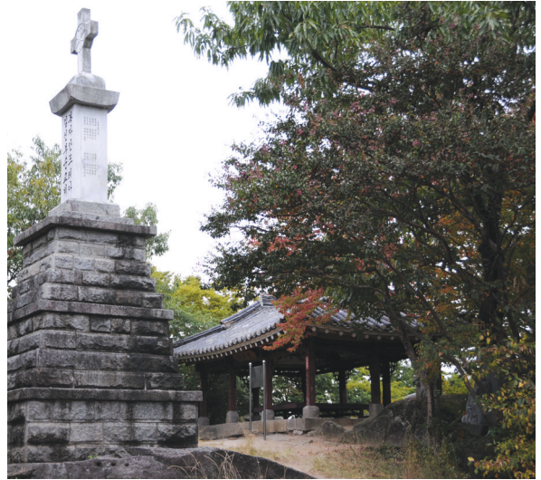
김대건 신부 순교기념비

나바위 성지가 하느님의 손길과 배려가 배어 있다는 중요한 증거는 김대건 신부의 착지(着地)가 그동안 알려진 강경 옥녀봉이 아니라 화산 나바위라는 호남교회 사연구소 김진소 신부의 입증에 기인한다. 김대건 신부의 입국 당시 강경포구는 전국 3대 포구의 하나로 크게 번창해 관원들의 검문이 심했고, 나암포구는 군량미를 취급해 감시가 철저해 두 곳으로 배가 들어오기에는 위험이 컸다. 그래서 김 신부는 이곳을 피하기 위해 금강 용두암에서 나바위까지 이어지는 샅강을 이