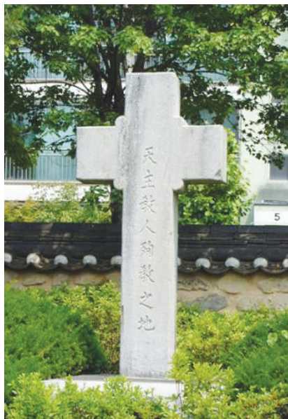
이명서 성인의 손자 이준명 아내들이 숭정 이 순교터를 매입하였고 1935년 전주본당 회장인 이학수 바오로가 숭정에서 순교하신 분들을 기리며 순교자 기념비를 세웠다.

1801년에 순교할 기회를 놓쳐 유배생활을 하였는데 이제는 외딴 곳에 숨어서 그 기회를 다시 놓칠 것을 생각하며 눈물을 흘렸다. 3일 뒤 전주 포졸들에게 체포되어 심한 고문을 당하였으나 꺾이지 않았다.