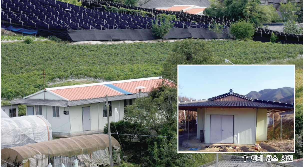
↑ 현재 공소 사진