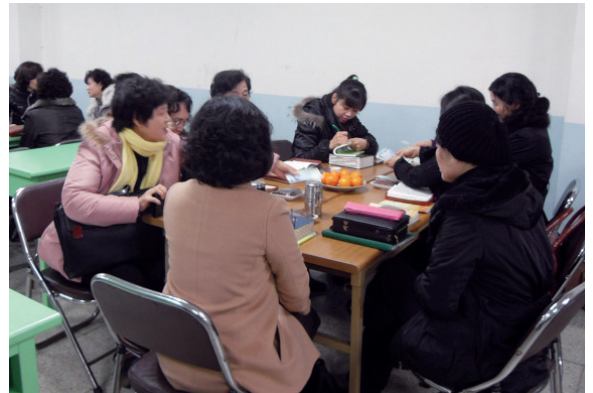
성서 40주간에 참여한 신자들

계기를 이뤘다. 작년부터 본당에서 실시하고 있는 성경교육 프로그램 ‘성서 40주간’과 야간 성경반 ‘여정’에도 신자들이 꾸준히 참여해 새록새록 말씀에 맛들이고 있다. 이와 함께 전례 안에서 모두가 공동체의 일원임을 느낄 수 있도록 돕고 있다. 성주간의 세족례 때에는 공동체의 참여의식을 적극 이끌기 위해 모든 신자들이 발 씻김에 참여한다.