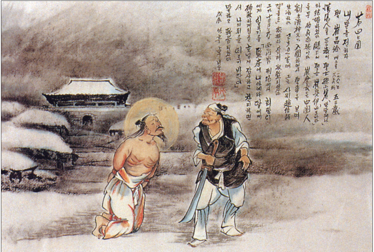
그림 | 탁희성 비오·글 | 김옥희 안나 수녀

내 말을 전하라 / 기해박해 때 최창흠 성인의 가족이 모두 체포되었다. 성인이 참수형을 받기 직전에 휘광이에게 옥에 있는 아내와 딸에게 “순교하게 됨을 주님께 감사하고 찬미하면서 나의 뒤를 따르기 바란다”는 이 한마디를 전해 달라고 부탁하며 순교하였다.