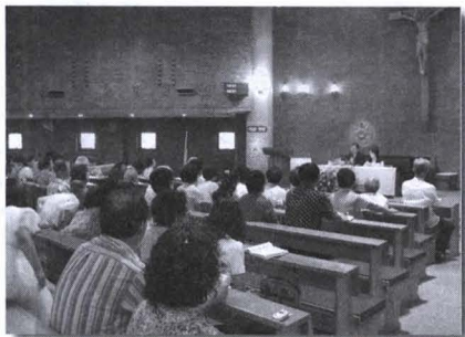
불꽃을 나누는데 앞장설 것을 다짐했다.