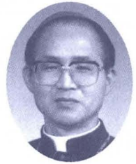
이 병 호(빈첸시오)주교

지금은 확실히 내가 너보다 훨씬 낮지만 그 때에는 이렇게라도 살아 있는 네가 훨씬 낮겠구나. 나는 죽었는데 너는 살아 있으니까. 살아서 움직이는 세상에 조금은 반응을 할 수 있으니까. 죽음을 배경에 놓고 볼 때 “살아있다”는 것은 말조차 얼마나 찬란한 빛을 내뿜는가! 아무리 느낌 없는 생명체라 해도 그것을 어떻게 죽은 것에 비할 수 있으랴?