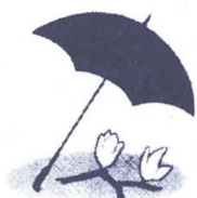
그림 한 병기