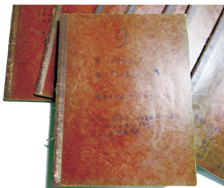
▲ 故 서정수 알렉시오 신부님 일기장

일이었는데, 텔레비전이 들어오면서 가족들 안에서 저녁시간의 활용이 어떻게 변화했는지를 알 수 있다. 텔레비전이 들어오면서 저녁마다 마을 사람들이 최내우의 집에 와서 텔레비전을 시청하는 바람에 개인생활에 적지 않은 방해를 받게 되었고, 또