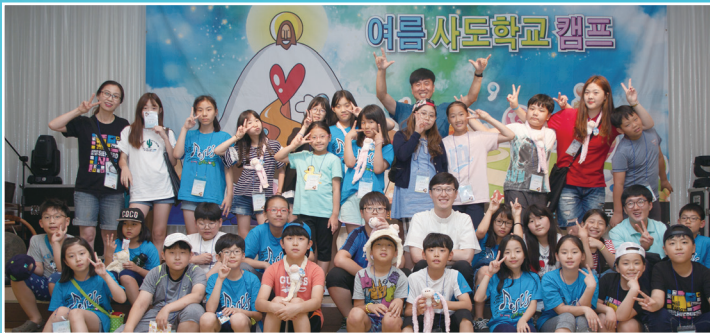
▲ 서일성당 - 여름 사도학교 캠프