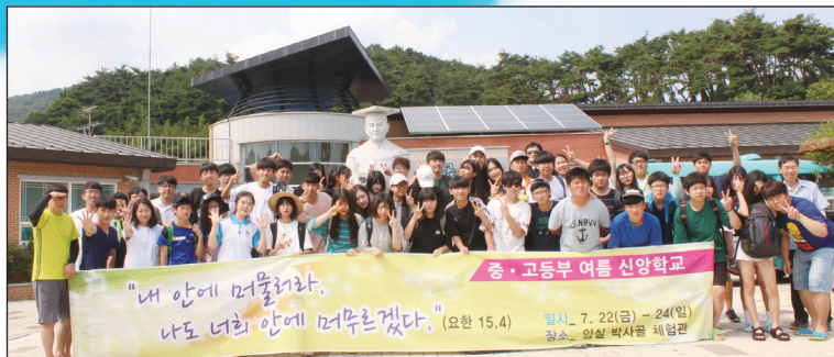
▲ 평화동 성당 - 중·고등부 여름 신앙 학교