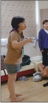
▲ 우림 성당 - 중