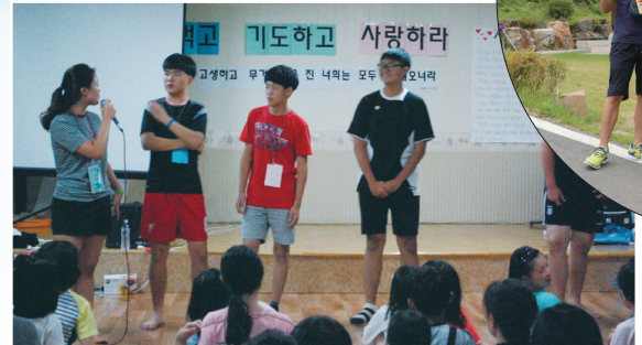
▲ 우전성당 - 여름 신앙 캠프