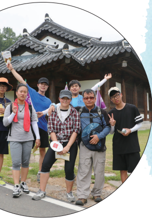
▲ 칠보 성당 - 중·고등부 도보순례