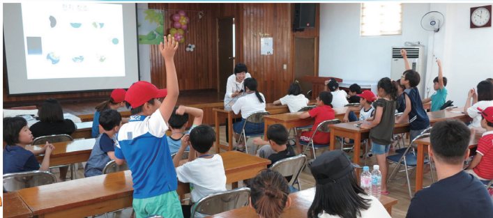
▲ 요촌성당 - 여름 신앙 캠프