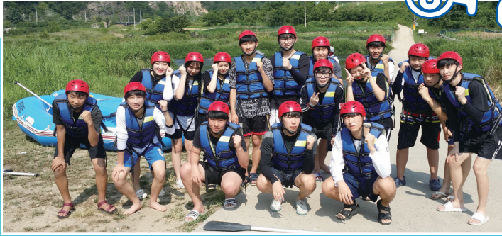
▲ 문정성당 - 중·고등부 신앙 캠프