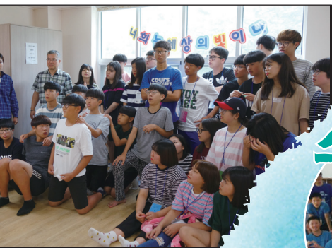
중·고등부 여름 신앙 캠프