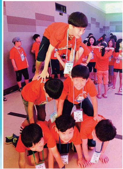
▲ 인후동 성당 - 여름 사도학교 캠프