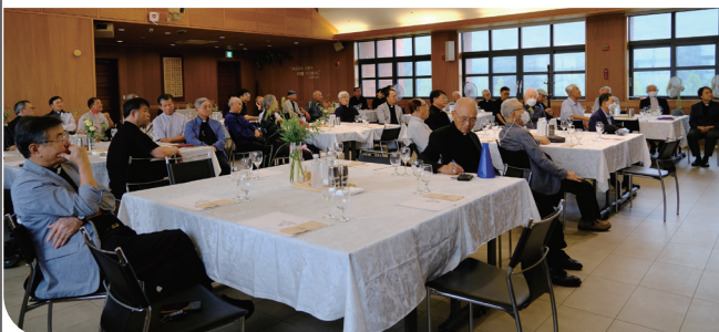
▲ 원로사목자 초대 의 날 9월 15일(금)